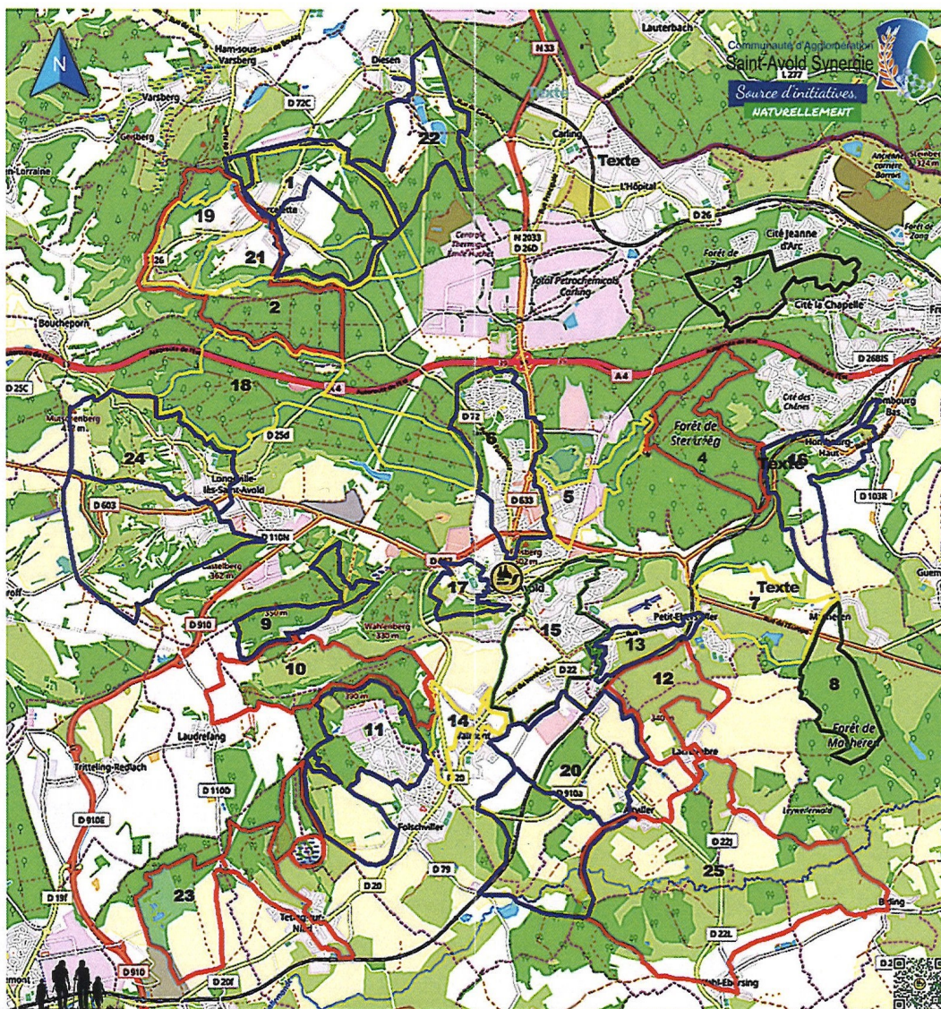
25 circuits pédestres balisés, d'une longueur cumulée de 260,5 km, numérotés de 1 à 25.